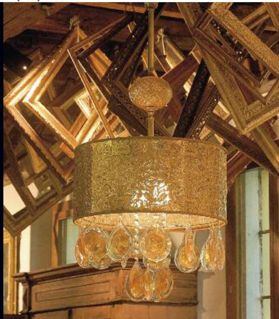
Art. Gold 003 h 130 cm • P Ø 50 cm 1x60W E27