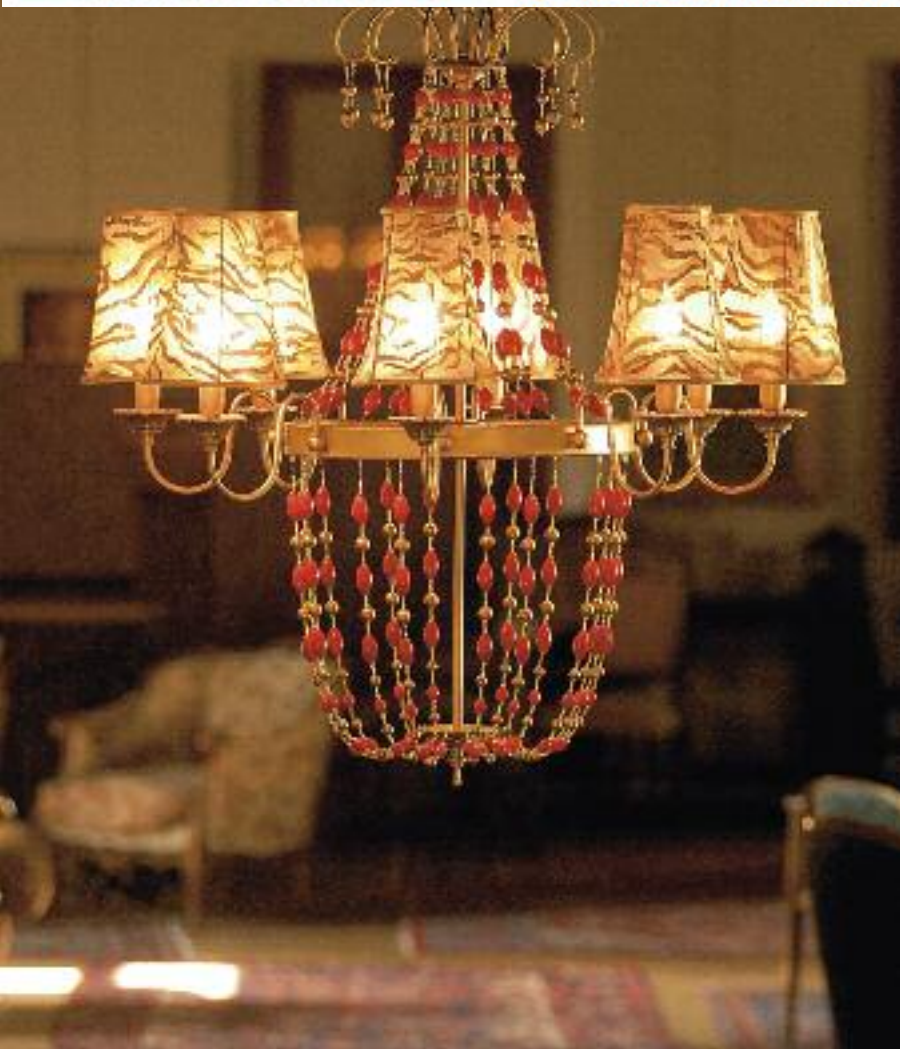
Art. 1380 RO h 105 cm • P Ø 90 cm 8x40W E14