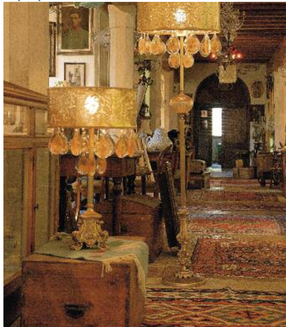
Art. Gold004 h 82 cm • P Ø 40 cm x60W E27