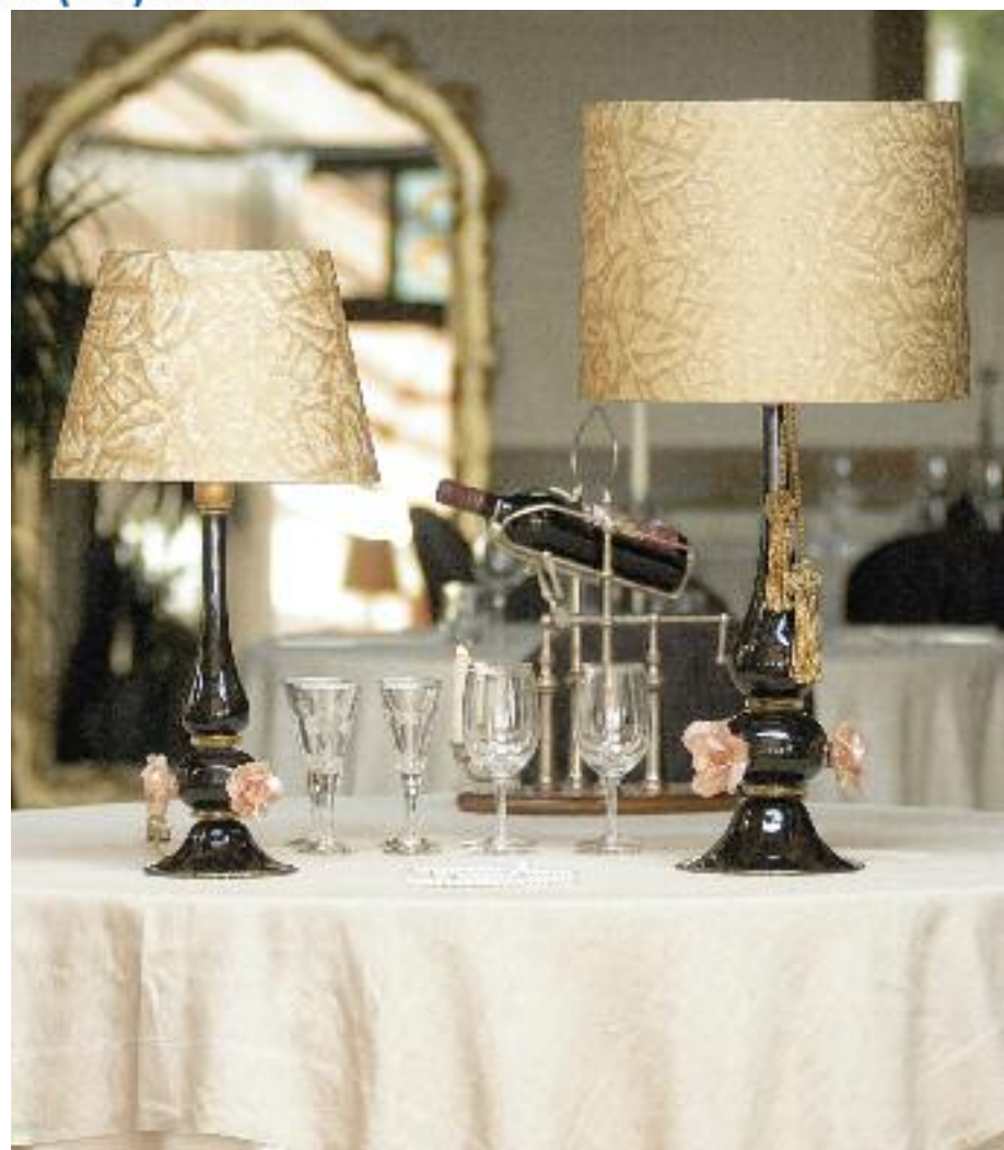
Art. 1377P h 60 cm • P Ø 33 cm 1x60W E27