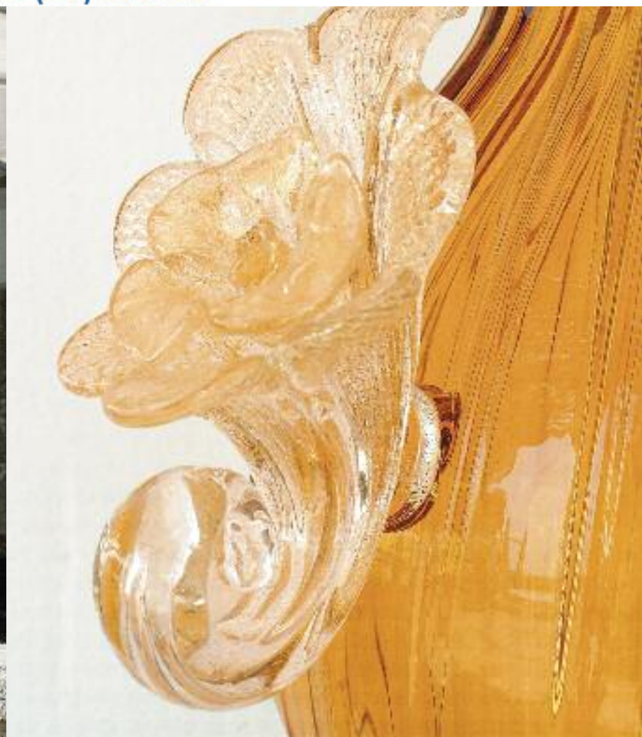
Art. 1375G h 72 cm • P Ø 31x21 cm 1x60W E27