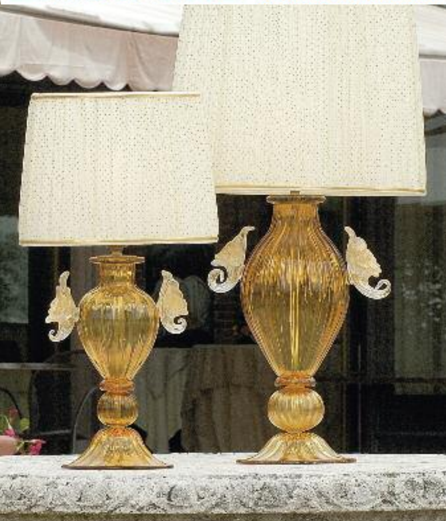
Art. 1375P h 55 cm • P Ø 37x18 cm 1x60W E27