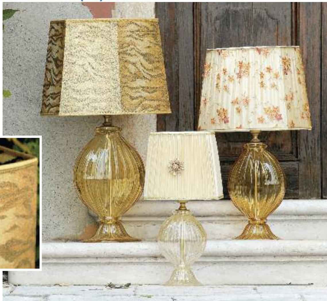
Art. 1363 G h 80 cm • P Ø 40 cm 1x60W E27