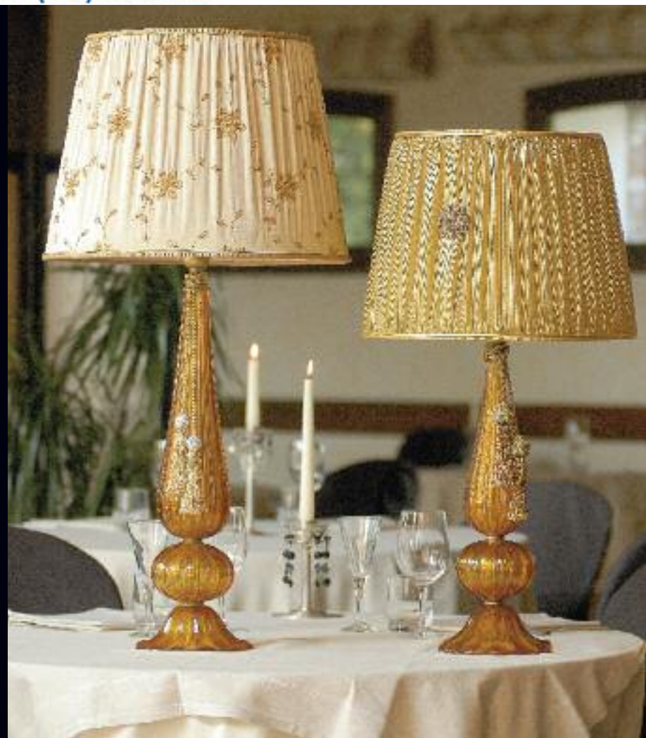
Art. 1384G h 88 cm • P Ø 42 cm 1x60W E27