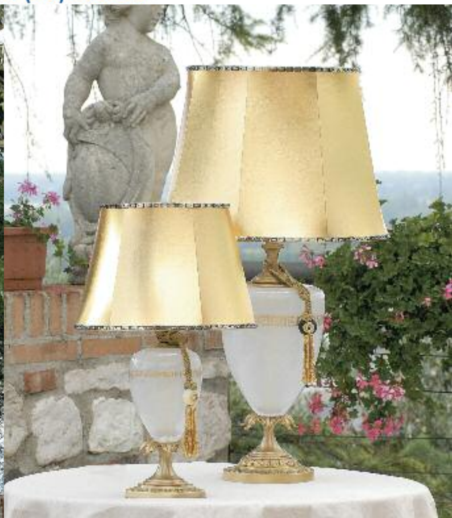
Art. 1374P h 53 cm • P Ø 33 cm 1x60W E27