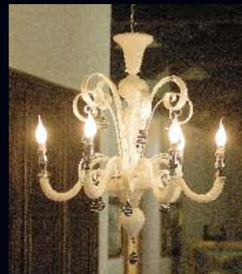
Art. 1381 bis h 80 cm • P Ø 70 cm 6x40W E14