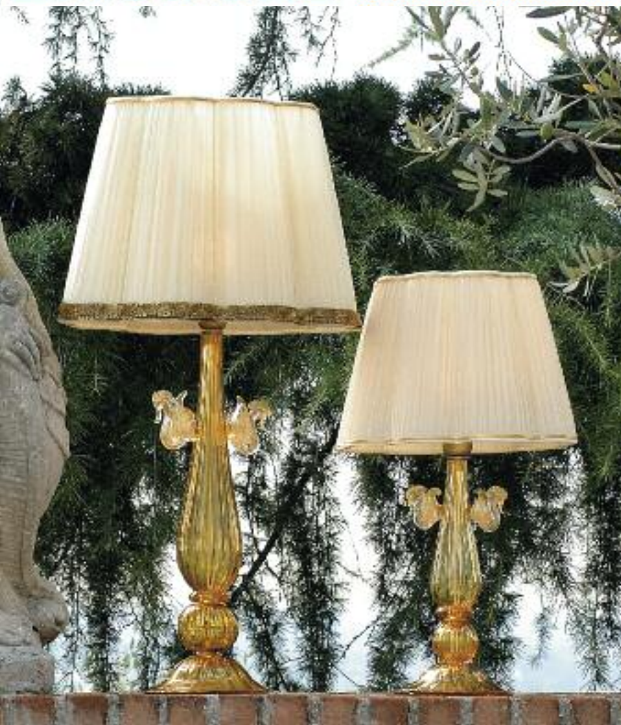
Art. 1376G h 70 cm • P Ø 40 cm 1x60W E27