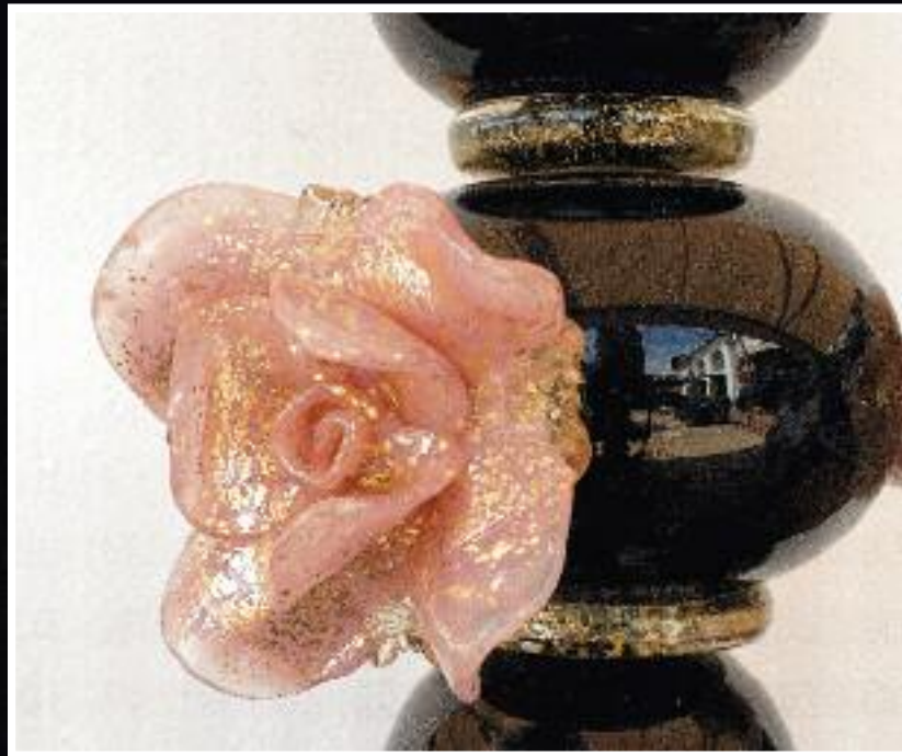
Art. 1377 A3 h 40 cm • P Ø 50 cm 3x40W E14