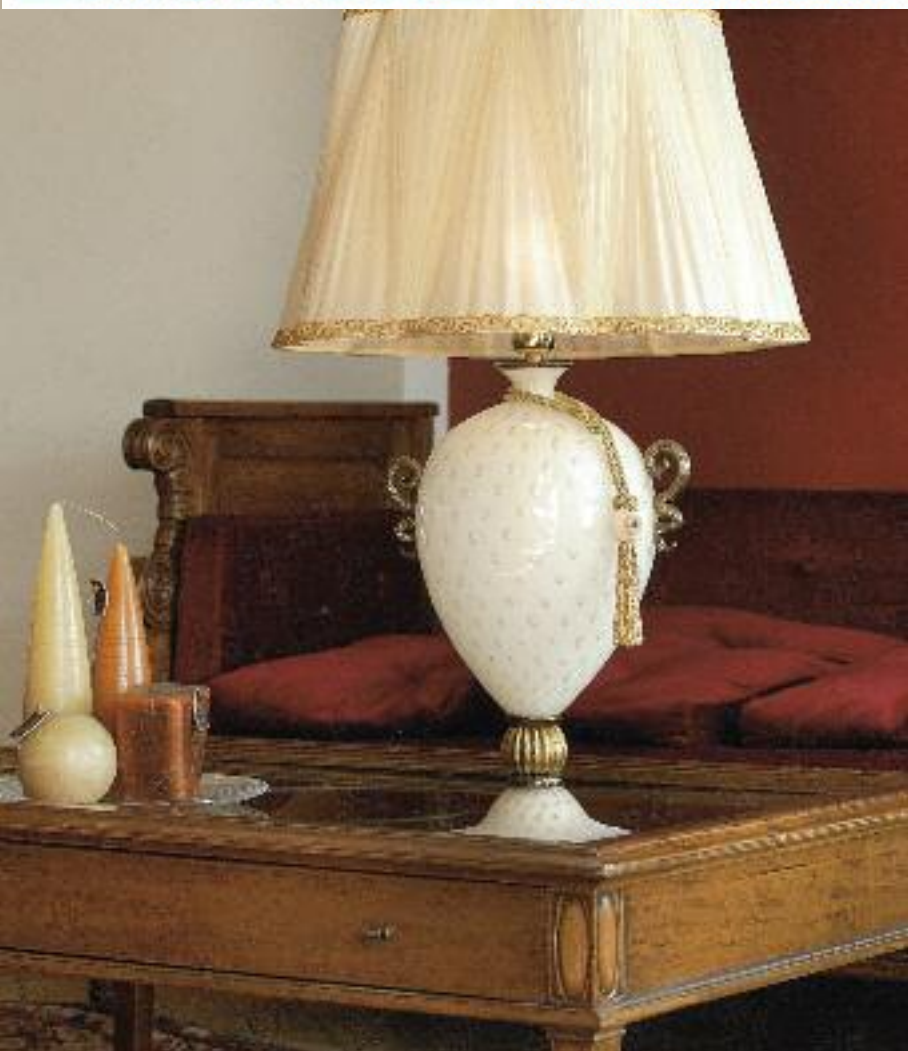
Art. 936 BI h 78 cm • P Ø 50 cm 1x60W E27