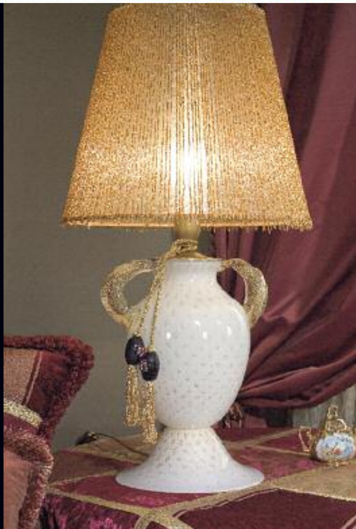
Art. 1378 bis h 77 cm • P Ø 40 cm 1x60W E27