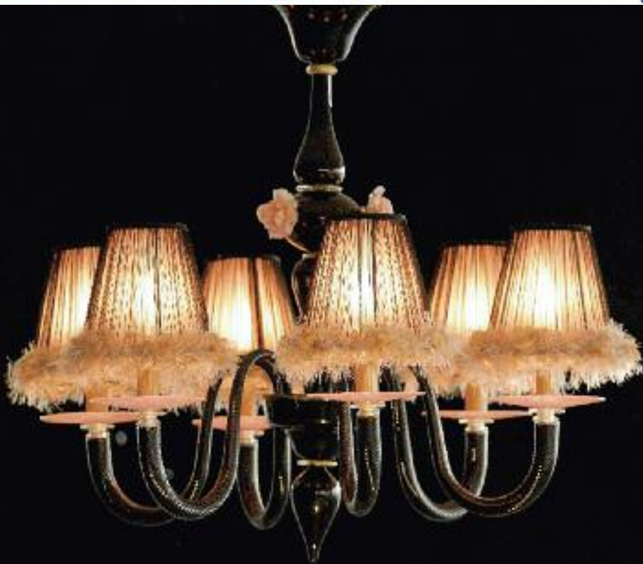
Art. 1377 CH6 h 80 cm • P Ø 90 cm 6x40W E14