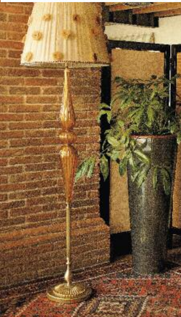
Art. 1384FL h 180 cm • P Ø 55 cm 2x60W E27