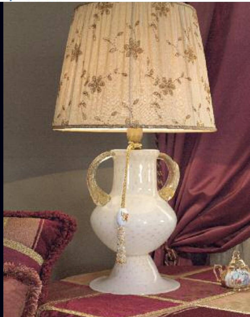
Art. 1378 tris h 75 cm • P Ø 45 cm 1x60W E27