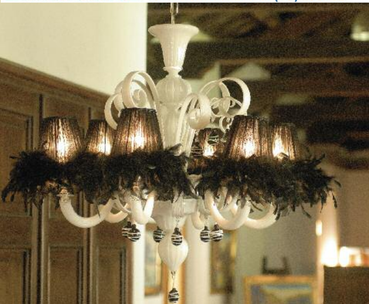
Art. 1381 h 80 cm • P Ø 80 cm 6x40W E14