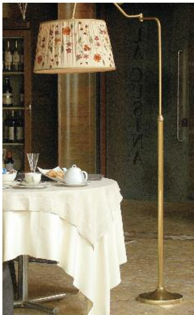
Art. 124 bis h 180 cm • P Ø 50 cm 1x60W E27