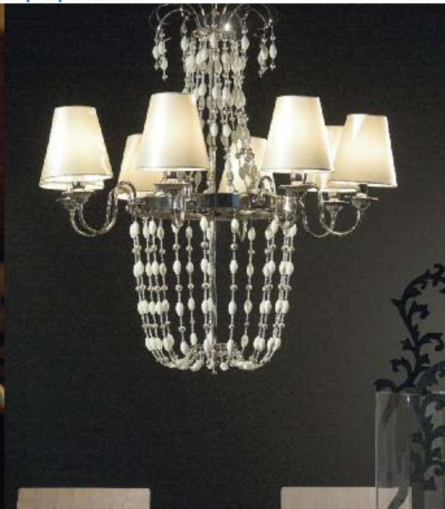
Art. 1380 BI h 105 cm • P Ø 90 cm 8x40W E14